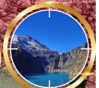
GUPIS ATTABAD LAKE